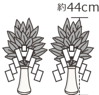
紙垂つき 神滝の風