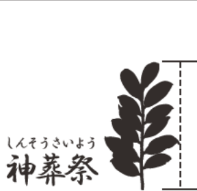
しんそうさいよう 神葬祭